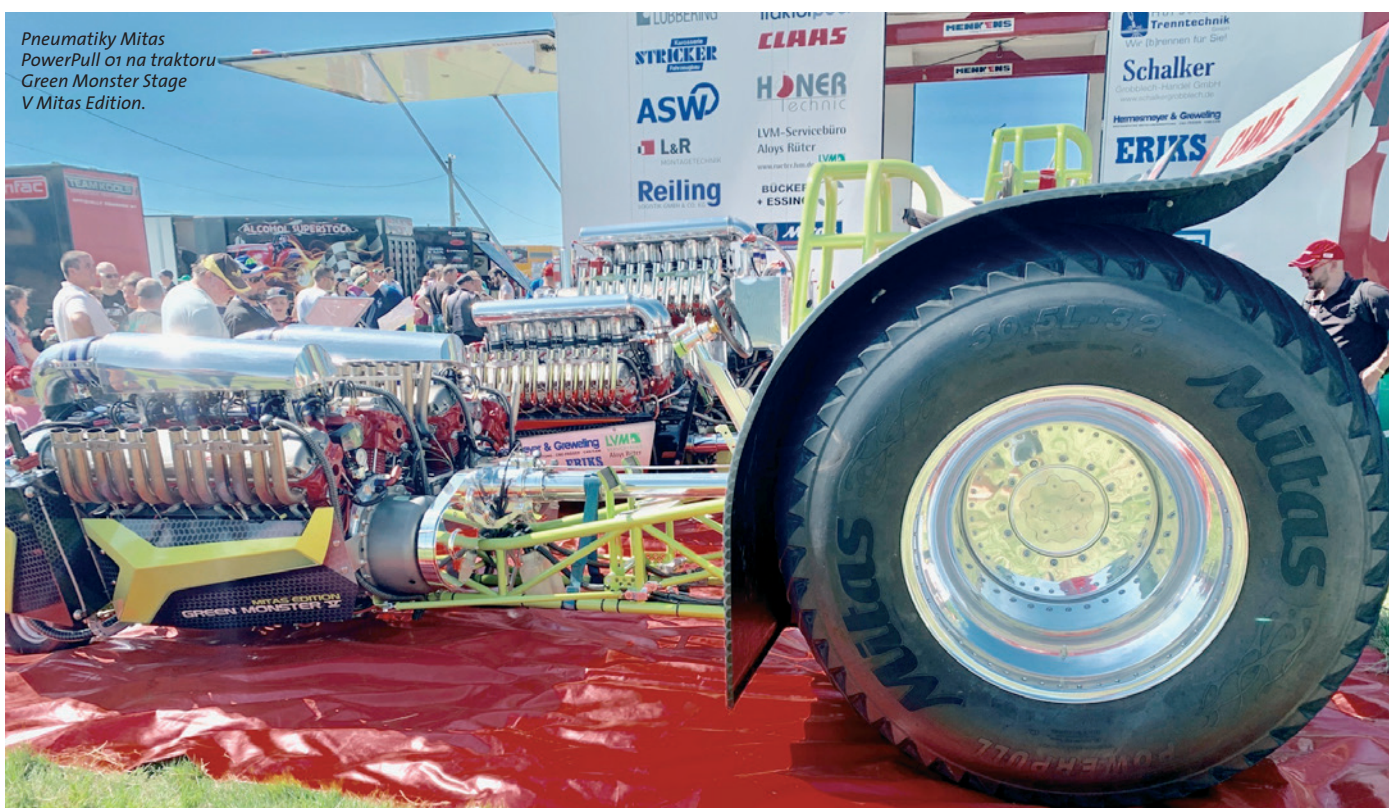
Pneumatiky Mitas PowerPull 01 na traktoru Green Monster Stage V Mitas Edition.

...počátky tractor pullingu se datují do dob, kdy se v zemědělství používala pouze koňská síla? Ale už tehdy se farmáři mezi sebou trumfovali, kdo má silnější koně. Začali tak soutěžit v tom, za jaký čas koňské spřežení utáhne senem nebo kameny naložený vůz na určitou vzdálenost, a tak se zrodil princip pullingových závodů. Postupem času nahradila koně technika a tyto soutěže se dál rozvíjely. První doložený „motorizovaný“ závod se datuje do roku 1929 a odehrál se ve Spojených státech. Dnes v tomto sportu přichází ke slovu moderní výkonné traktory na speciálních pneumatikách a Mitas je důležitou součástí pullingového světa!