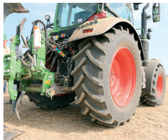
SST pneumatiky Mitas omezují takzvaný dunivý efekt.