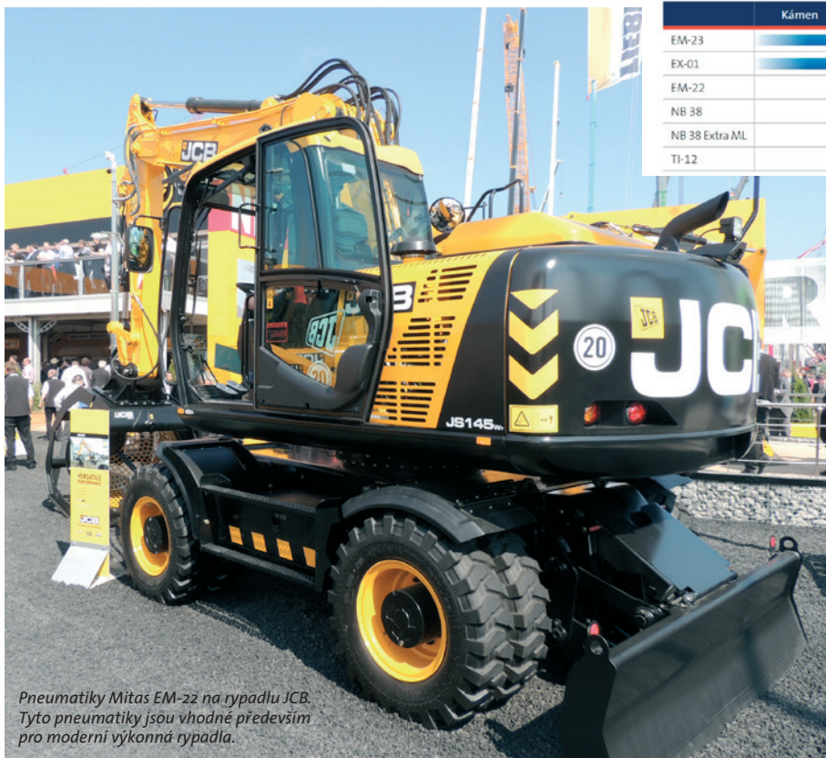
Pneumatiky Mitas EM-22 na rypadlu JCB. Tyto pneumatiky jsou vhodné především pro moderní výkonná rypadla.

Staveniště rozhodně není komfortním pracovním místem. Nebezpečně povrchy, písek, hluboké bahno nebo naopak ostré kamení – to jsou terény, v nichž se musí stavební stroje bezpečně a také efektivně pohybovat. Bezchybné fungování kolových rypadel v těchto podmínkách závisí z velké části na volbě vhodných pneumatik. Jaké rypadlové pneumatiky Mitas tedy vybrat pro práci v různých podmínkách?