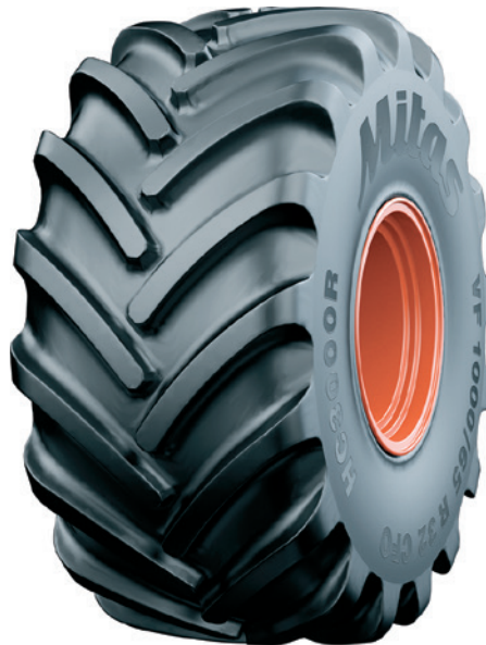
Vizualizace jedné z novinek - dezénu HC3000R.

Mitas dále významně rozšířil řadu svých HCM (High Capacity Municipal) pneumatik, do níž přibyly v roce 2019 tři nové rozměry. Jeden z nich - 650/65R42 IND 176A8/171D HCM TL - bude představen na Agritechnice. Tyto pneumatiky jsou určeny především pro komunální traktory užívané ve městech a při údržbě silnic, pro teleskopické manipulátory a nakladače a jsou vhodné pro celoroční použití. K jejich výjimečným vlastnostem patří díky konstrukci s ocelovým nárazníkem vysoká životnost, unikátní provedení dezénu v centrální části běhounu a vynikající záběrové vlastnosti díky většímu počtu hran na dezénových figurách. HCM pláště Mitas nabízí